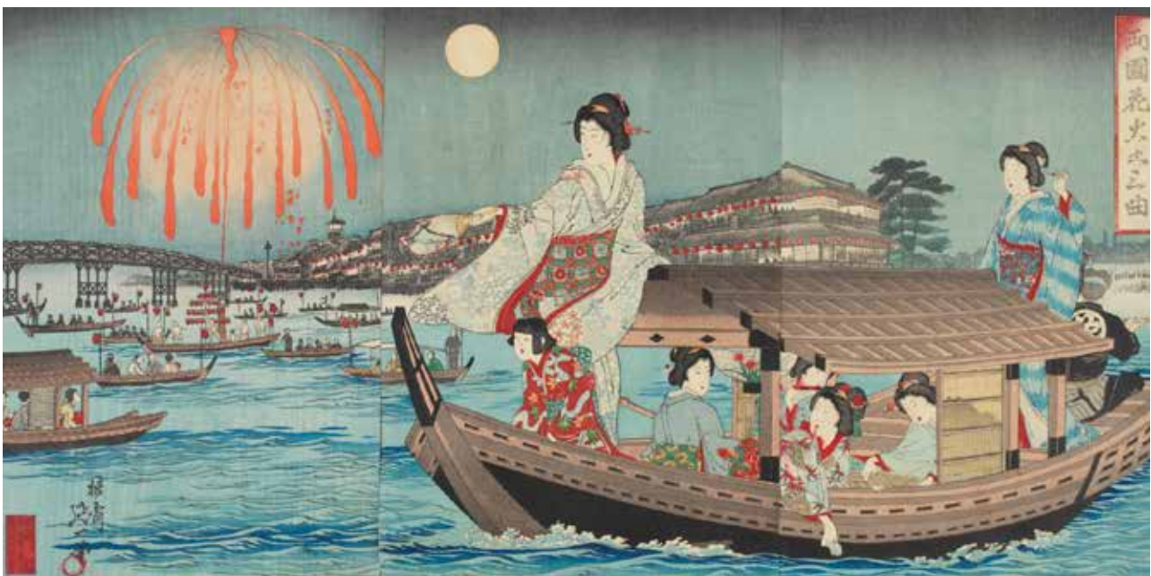
Musique Sankyoku des feux d'artifices de Ryōgoku, Watanabe Nobukazu, fin du XIX e -début du XX e siècle

Cette section se divise en deux catégories : d'un côté les festivals et ses artistes, de l'autre les pompiers et leurs acrobaties.