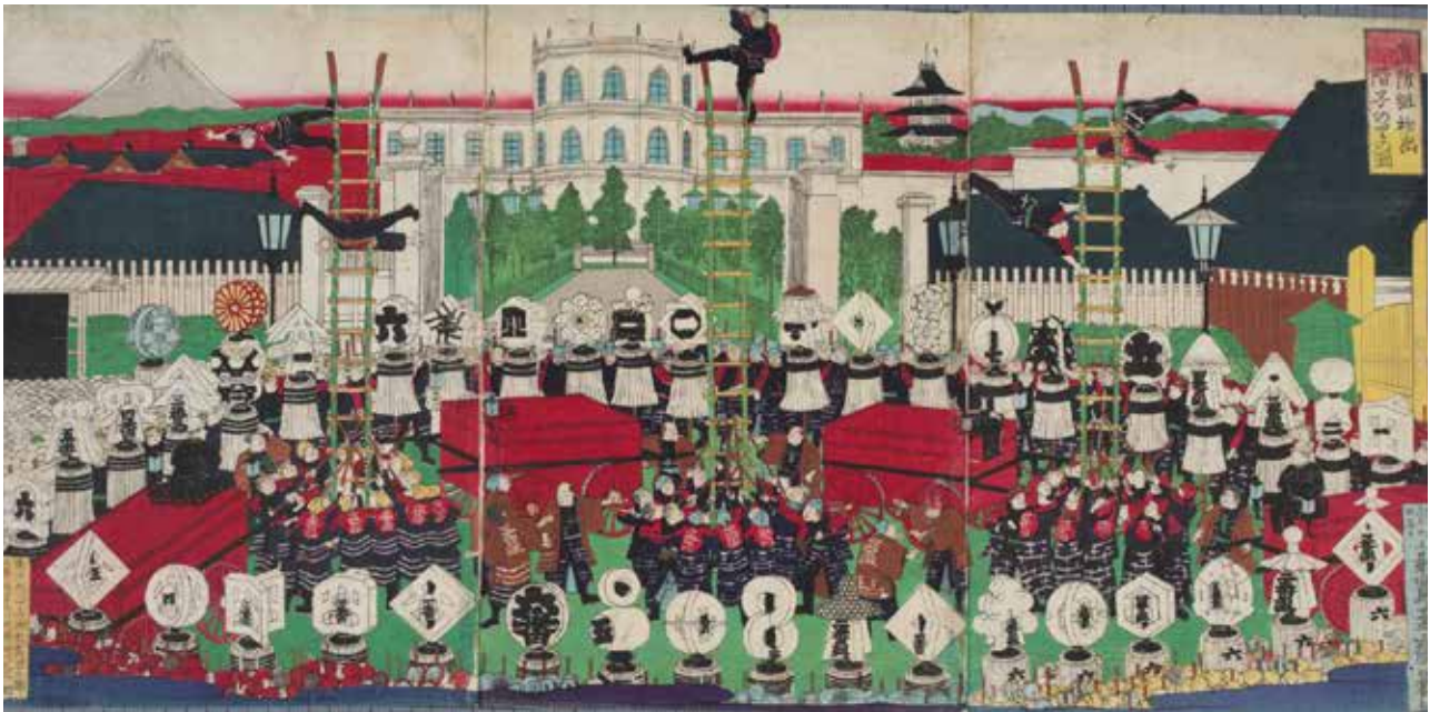
Acrobaties sur échelles des pompiers lors du premier événement de l'année, Utagawa Yoshitora, 1876

Si les feux d'artifice rencontrent un tel succès au Japon, c'est parce qu'ils incarnent parfaitement une sensibilité esthétique bouddhiste basée sur la conscience de l'impermanence. Notion désignée sous le terme de mono no aware , elle exprime l'émotion ressentie face à la beauté éphémère des choses, que l'on retrouve au Japon avec l'appréciation des fleurs de cerisiers.