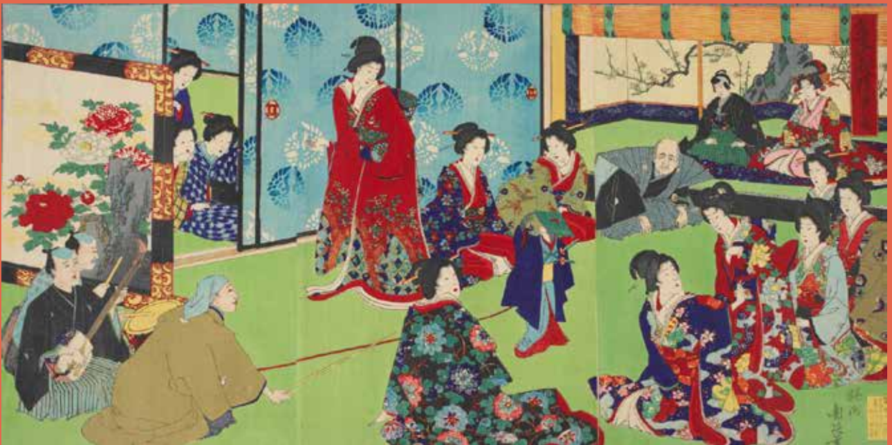
Montreur de singe dans le palais intérieur, Toyohara Chikanobu, fin des années 1880