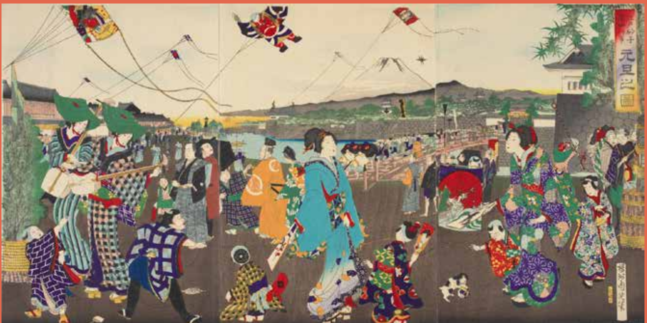
Jour de l'An, de la série Événements annuels [des Sables] d'Edo, Toyohara Chikanobu, 1885