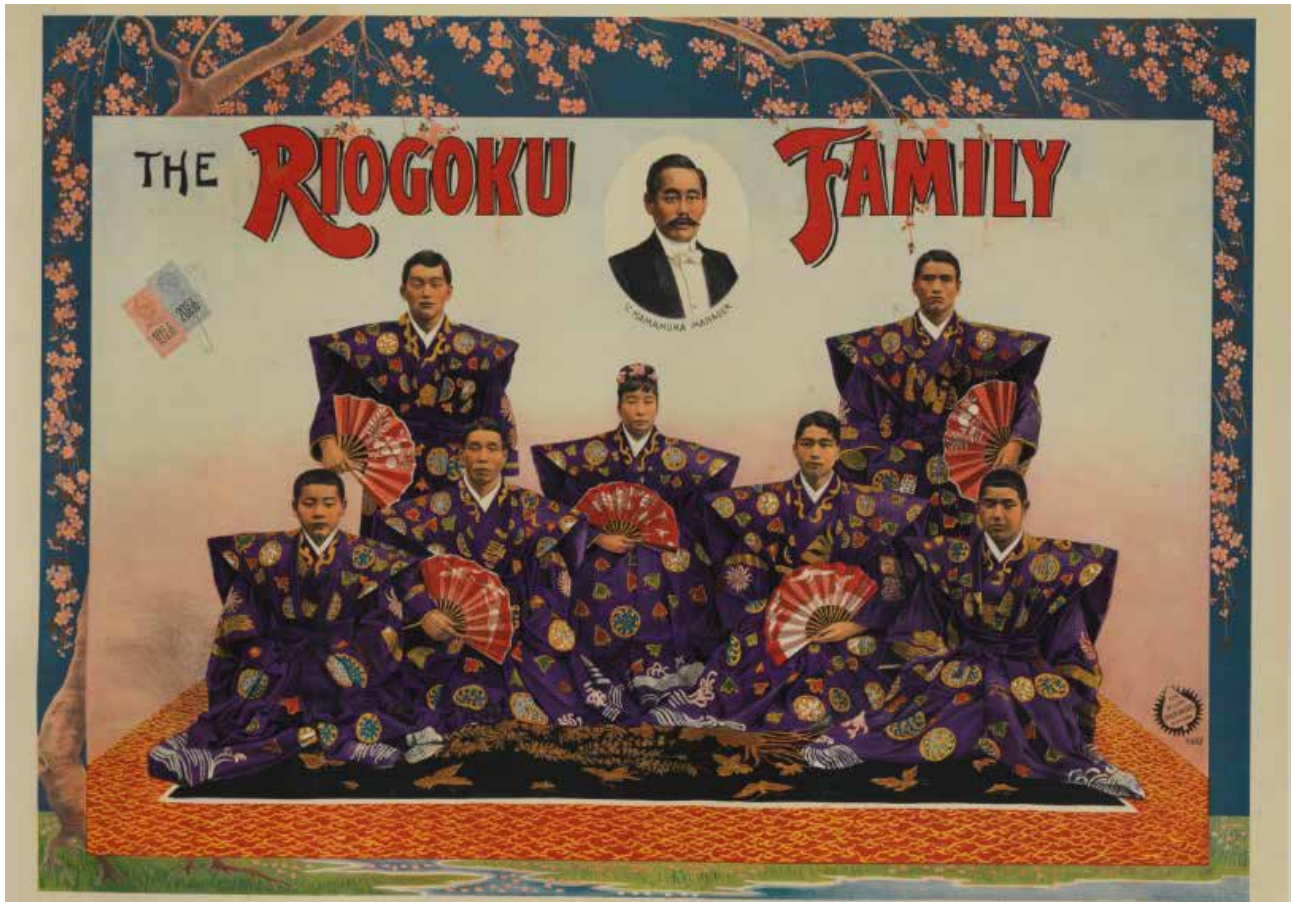
The Riogoku Family, Adolph Friedländer, 1907