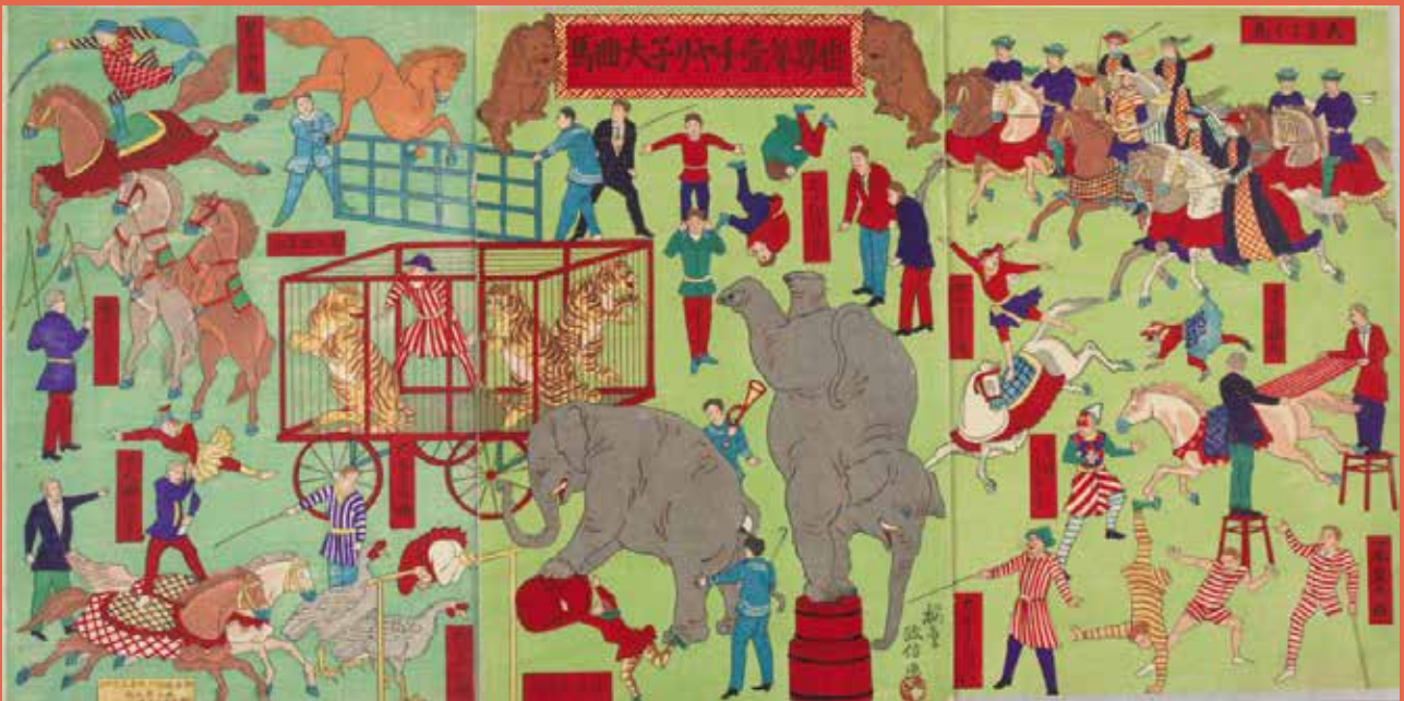
Le plus grand cirque du monde, le cirque Chiarini, Utagawa Masanobu, 1886