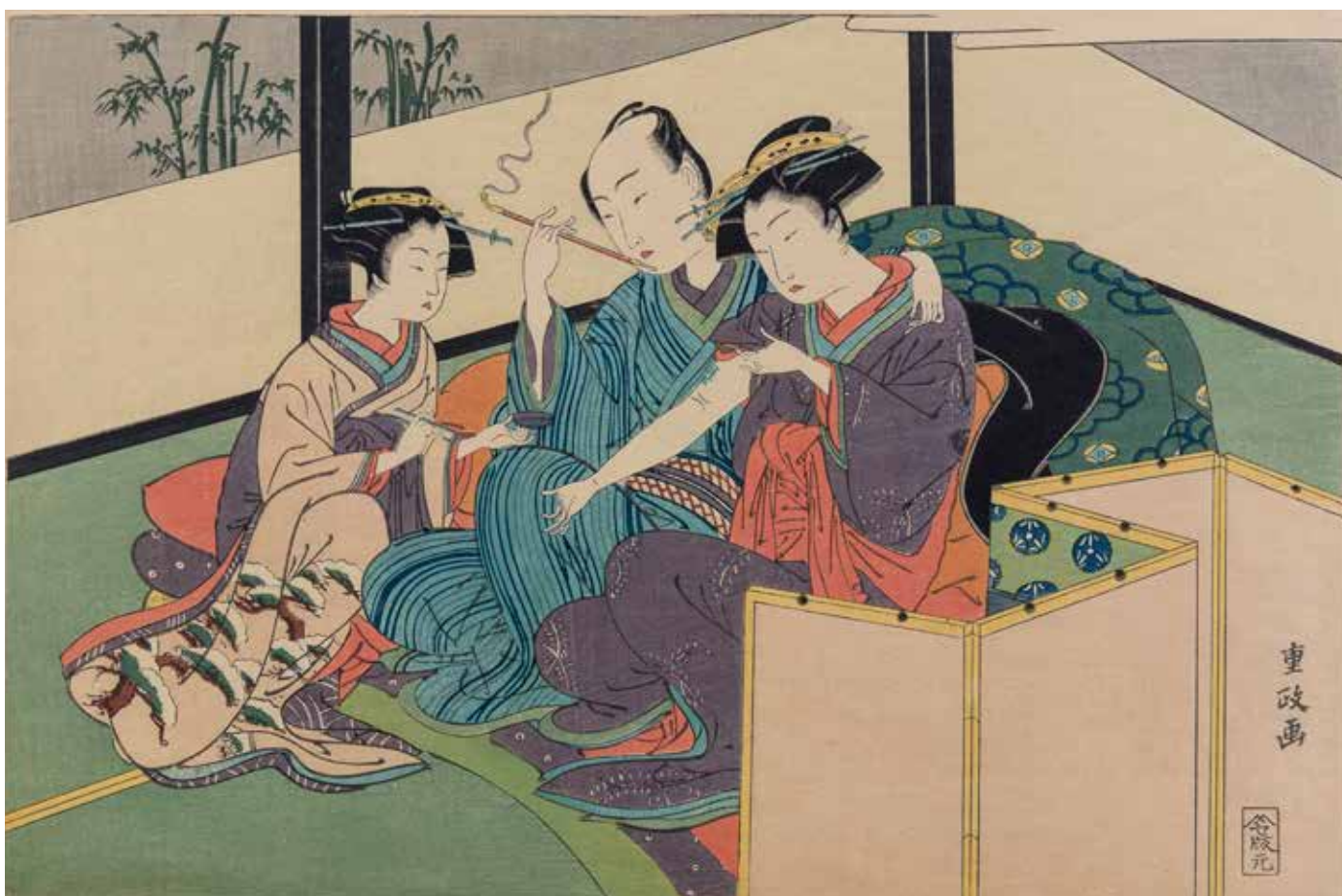
Kitao Shigemasa (1739-1820), Sans titre, illustration pour un livre, Japon, réimpression de l'ère Shōwa (1926-1989), première moitié du XX e siècle, xylogravure polychrome sur papier, 25,4 x 37,5 cm