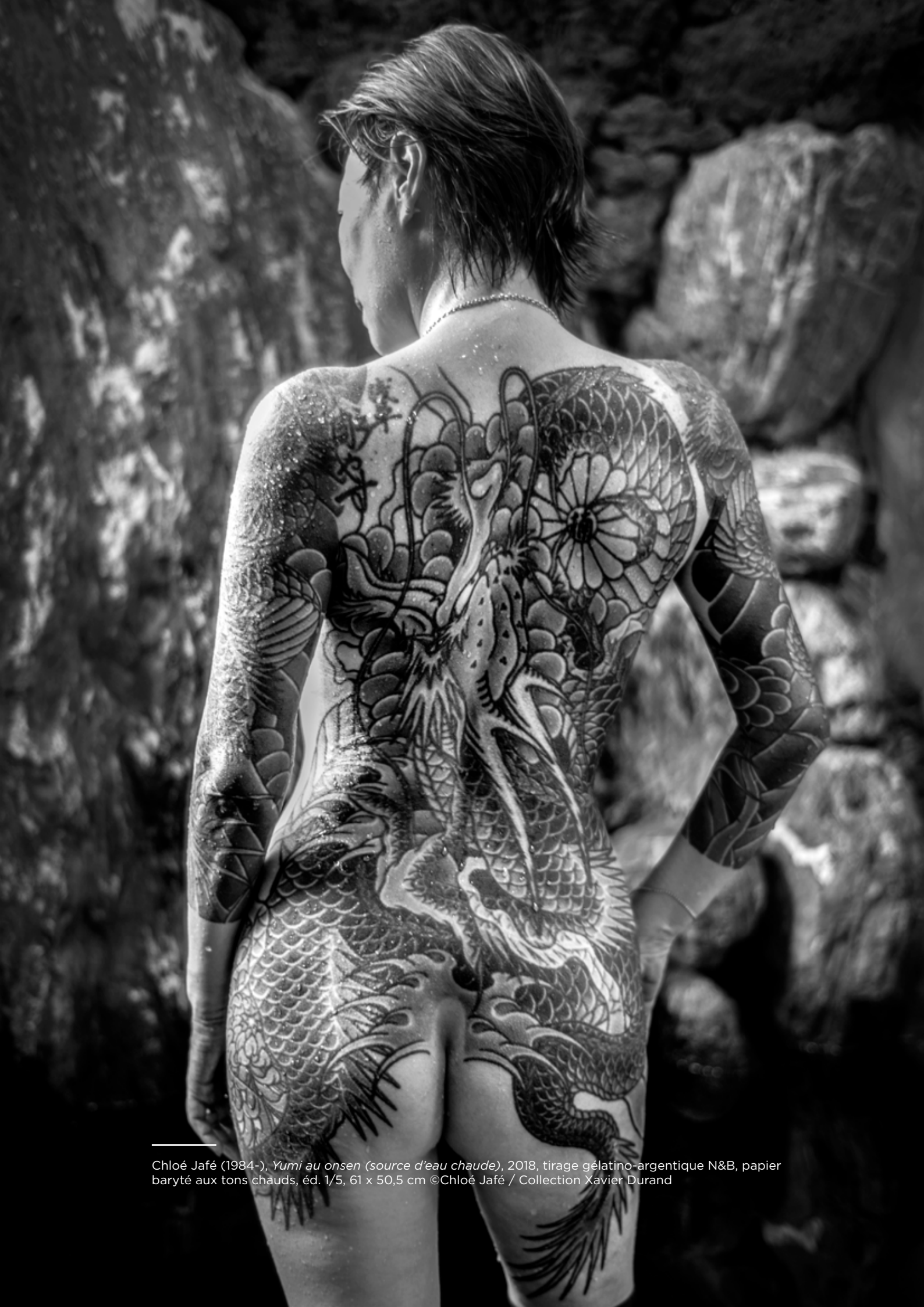
Chloé Jafé (1984-), Yumi au onsen (source d'eau chaude) , 2018, tirage gélatino-argentique N&B, papier baryté aux tons chauds, éd. 1/5, 61 x 50,5 cm