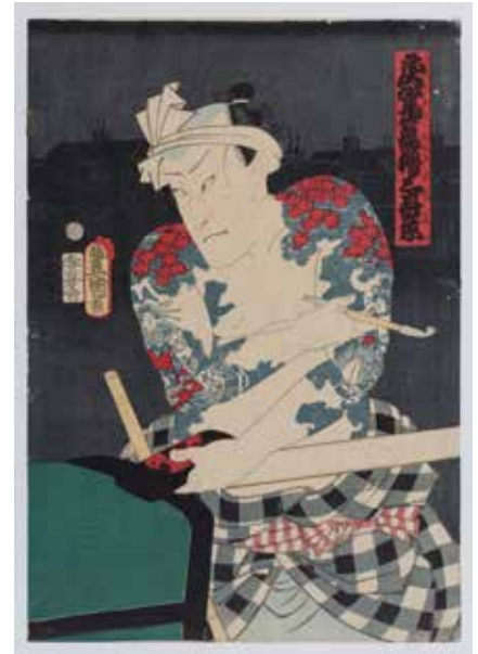
Utagawa Kunisada I (1786-1865), Parodie de la pièce de kabuki intitulée Le retour du palanquin, Japon, époque d'Edo (1603-1868), 1859, xylogravure polychrome sur papier, 36,4 x 75,5 cm