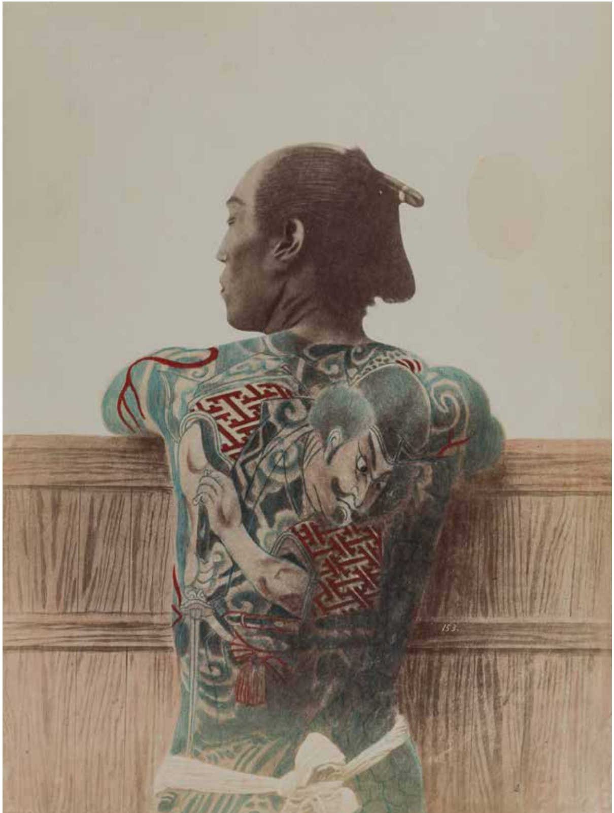
Stillfried (1839-1911) & Andersen (1880-1956), Sans titre (homme tatoué), Japon, ère Meiji (1868-1912), vers 1877, épreuve sur papier albuminé coloriée à la main, 26,4 x 19,9 cm