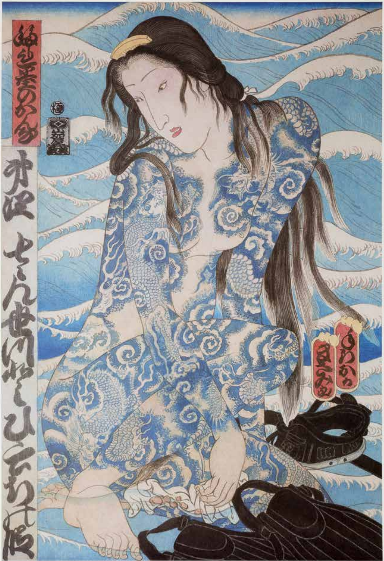
Wave Seven (Tattooed Woman of Surimi Inochi) MASAMI TERAOKA © 1984