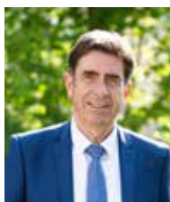
Charles Ange GINÉSY Président du Département des Alpes-Maritimes

Cette exposition-miroir remet en perspective les tendances actuelles qui se nourrissent de codes ancestraux. Elle restitue la dimension onirique d'un art vivant et poétique.